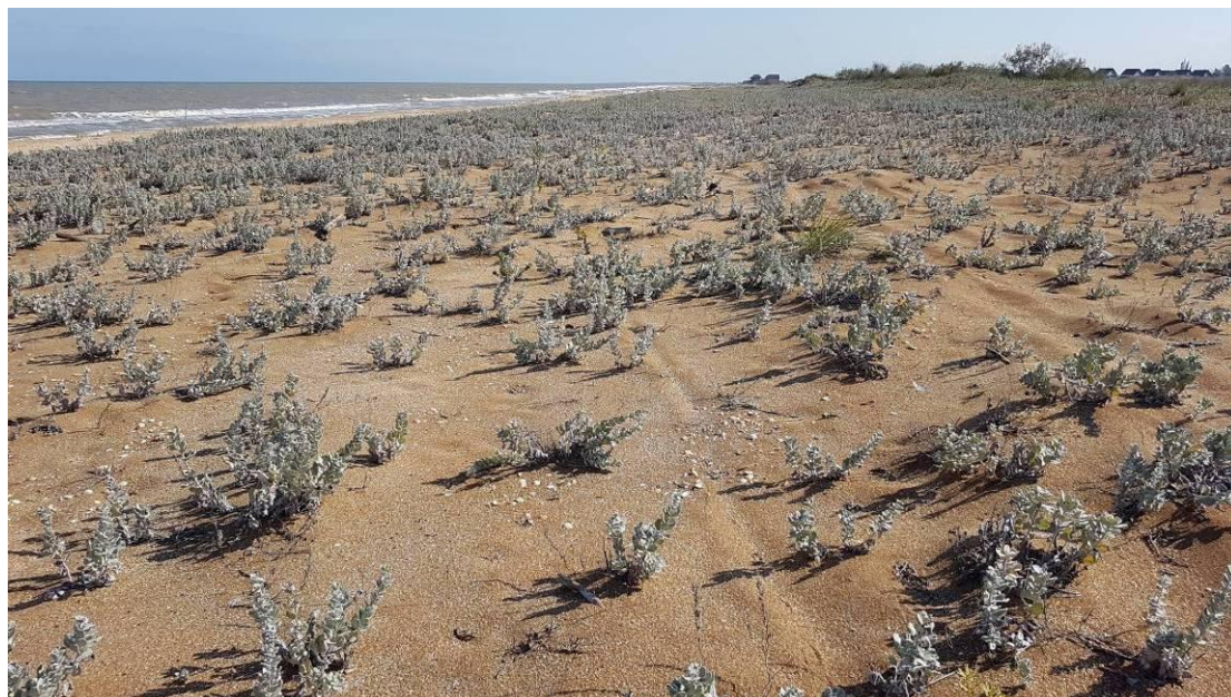
Рис. 1. Сообщество асс. Leymo racemosi–Convolvuletum persici Korolyuk ass. nov. в окрестностях с. Инче (октябрь 2021 г.).