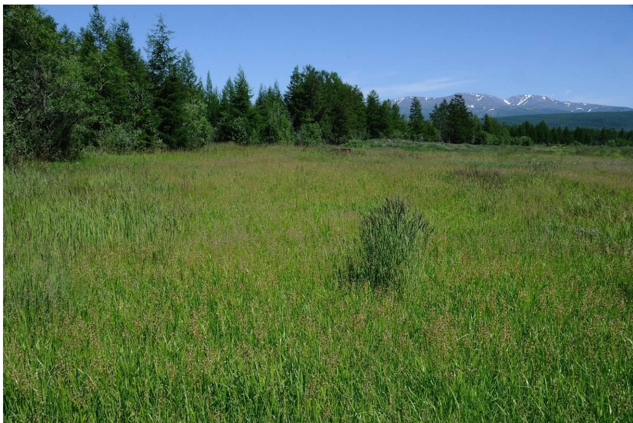
Рис. 4. Сенокосный луг асс. Artemisio leucophyllae–Hierochloetum odoratae Sinelnikova ass. nov. в окрестностях с. Оротук.