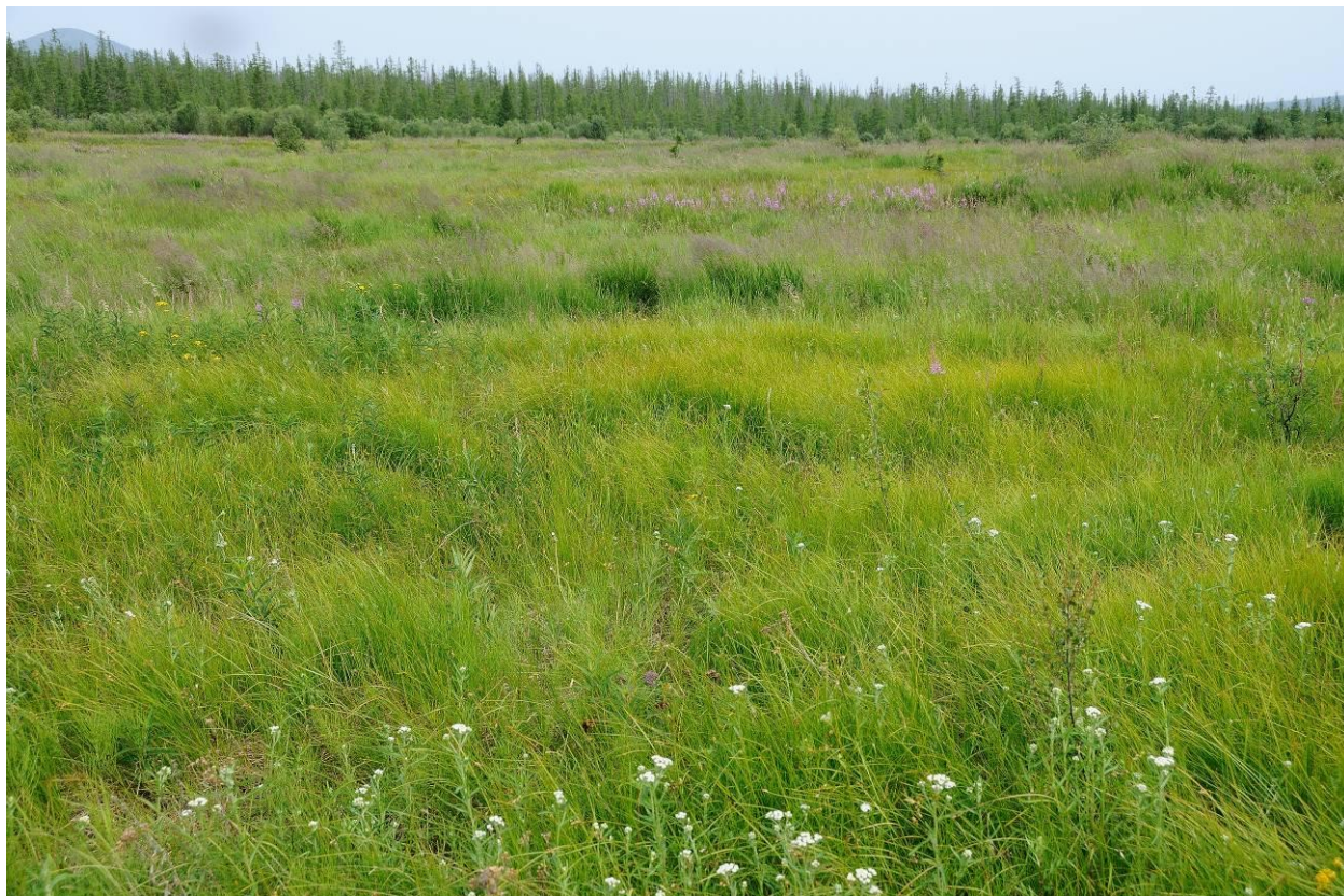
Рис. 3. Сообщество асс. Tanaceto borealis–Caricetum pallidae Sinelnikova ass. nov. вблизи заброшенного в 1992 году поселка Чигичинах.