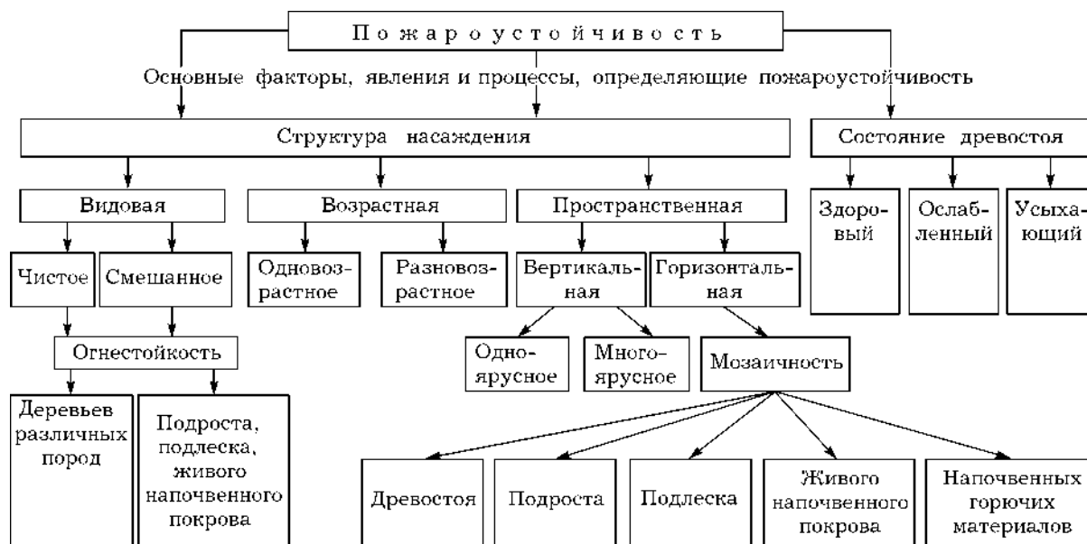
Рис. 2. Схема пожароустойчивости насаждения.

к пожару. Данное качество обусловлено как биологическими свойствами вида, так и географическим положением места его произрастания.