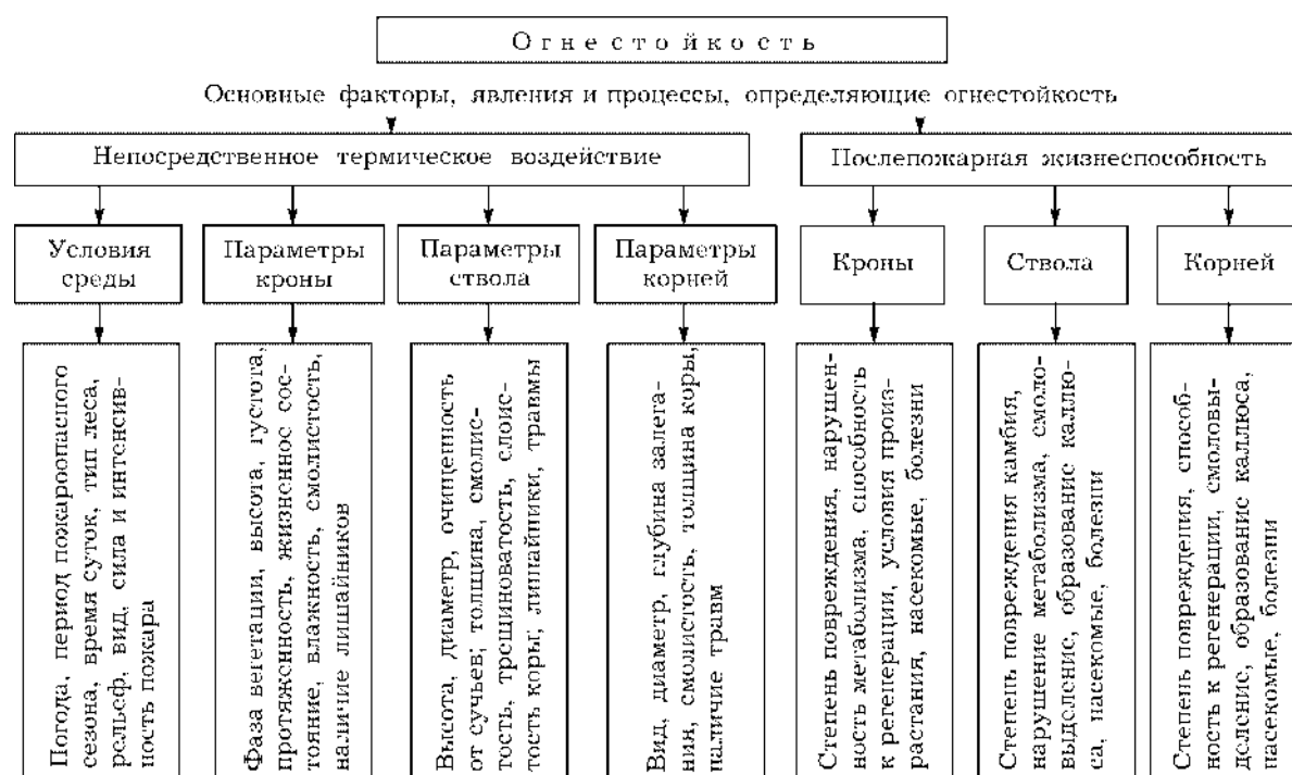
Рис. 1. Схема огнестойкости дерева.

Степень непосредственного повреждения кроны в значительной мере обусловлена фазой вегетации, а также ее морфологическими параметрами. Фаза вегетации важна в связи с различной чувствительностью ассими-