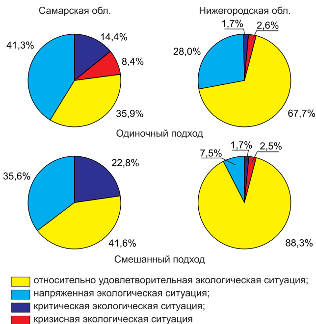
Рис. 1. Доля экологически благополучных и неблагополучных районов в общей структуре территорий Самарской и Нижегородской областей

счет перехода Алексеевского и Волжского районов из кластера с кризисной ситуацией в кластер с ситуацией критической. В Нижегородской области количество районов с критической и кризисной экологической ситуацией осталось неизменным: критическая экологическая ситуация характерна для Кстовского района этой области, кризисная – для Краснооктябрьского и Сеченовского районов. Таким образом, смешанный подход представляется более адекватным для выполнения экологического районирования.