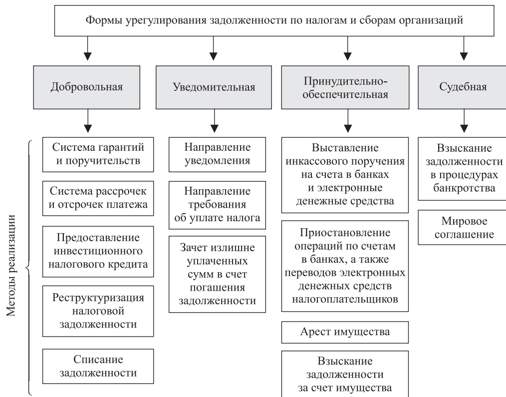
Рис. 1. Классификация форм урегулирования задолженности по налогам и сборам организаций