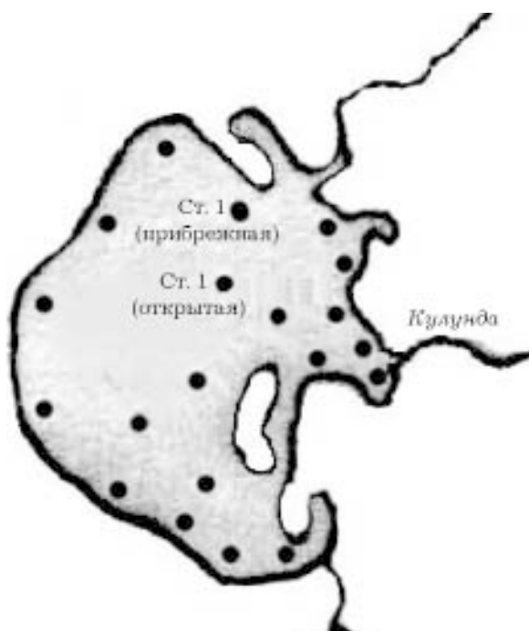
Рис. 1. Карта-схема оз. Кулундинское с указанием станций отбора проб фито- и зоопланктона в 2001–2002 гг.

Фито- и зоопланктон оз. Кулундинское исследовали в период открытой воды с апреля по октябрь 2001–2002 гг. по всей акватории на 20 стандартных станциях (рис. 1) одновременно с измерением температуры, прозрачности и общей минерализации воды. На ст. 1 фитопланктон исследовали в прибрежной и открытой частях озера. Различные по размерам, типу и степени минерализации озера Кулундинской низменности (содовые – Петуховское, Танатар-2; хлоридные – Баужансор, Левый и Правый Близнецы, Горносталево, Иодное, Кучукское, Ломовое, Минестрал, Николаев Берег, Северный залив, Узкое) исследовали ежемесячно. Отбор, фиксацию и обработку проб фито- и зоопланктона, визуальные наблюдения за распределением рачка по акватории озер проводили по стандартным методикам [19, 20]. Для оценки качества воды и определения зоны сапробности рассчитали индекс сапробности методом Пантле и Букка в модификации Сладечека [21, 22]. Накопленные данные по мониторингу рачка Artemia sp. стали базой при разработке усовершенствованной методики расчета ОДУ [23].