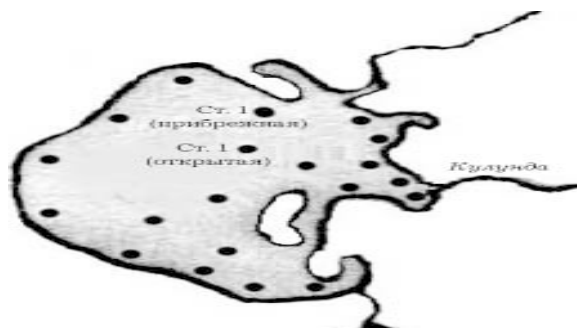
Рис. 2. Изменение численности фитопланктона в оз. Кулундинское на ст. 1 (прибрежная) в 2001–2002 гг.

В развитии фитопланктона озера наблюдалось два максимума – позднеосенний, который в зависимости от условий года мог сдвигаться на начало календарного лета, и летне-осенний (см. рис. 2). Первый максимум обусловлен развитием нитчатых синезеленых водорослей – Lyngbya martensiana Menegh.