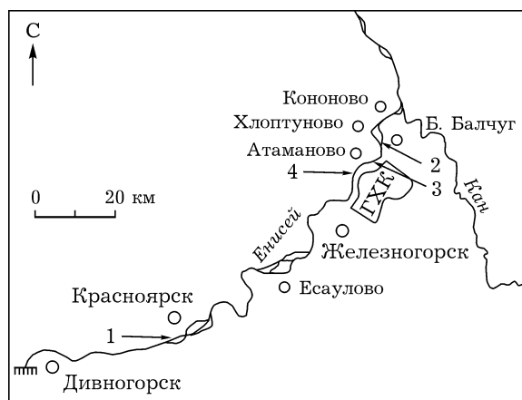
Рис. 1. Карта-схема участка р. Енисей с указанием точек пробоотбора

Пробы донных отложений (ДО) отбирали в октябре 2012 г. в р. Енисей на участках с разным уровнем радиоактивного загрязнения. Расстояние по течению реки определяли с помощью судходной карты р. Енисей [Карта..., 2008]. За точку отсчета принят речной вокзал г. Красноярск. Фоновая проба (ДО-1) отобрана со стороны западного берега реки, в территориальных границах пос. Удачный, около 12 км выше речного вокзала г. Красноярск (рис. 1). В зоне радиоактивного и химического загрязнения реки были отобраны пробы со стороны восточного берега: ДО-2 – вблизи с. Большой Балчуг, ДО-3 – вблизи с. Атаманово и ДО-4 – в устье р. Шумиха, на расстоянии 97, 86 и 80 км ниже Красноярск соответственно. Пробы ДО отбирали в ме-