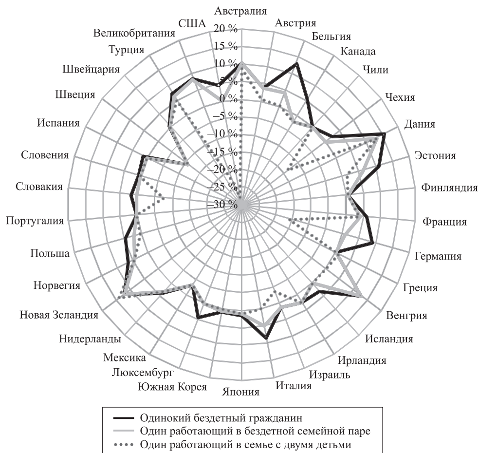
Рис. 1. Диаграмма распределения налоговой нагрузки по группам налогоплательщиков со средним размером начисленной заработной платы в 50 % от средней начисленной заработной платы по национальной экономике в 2013 г.