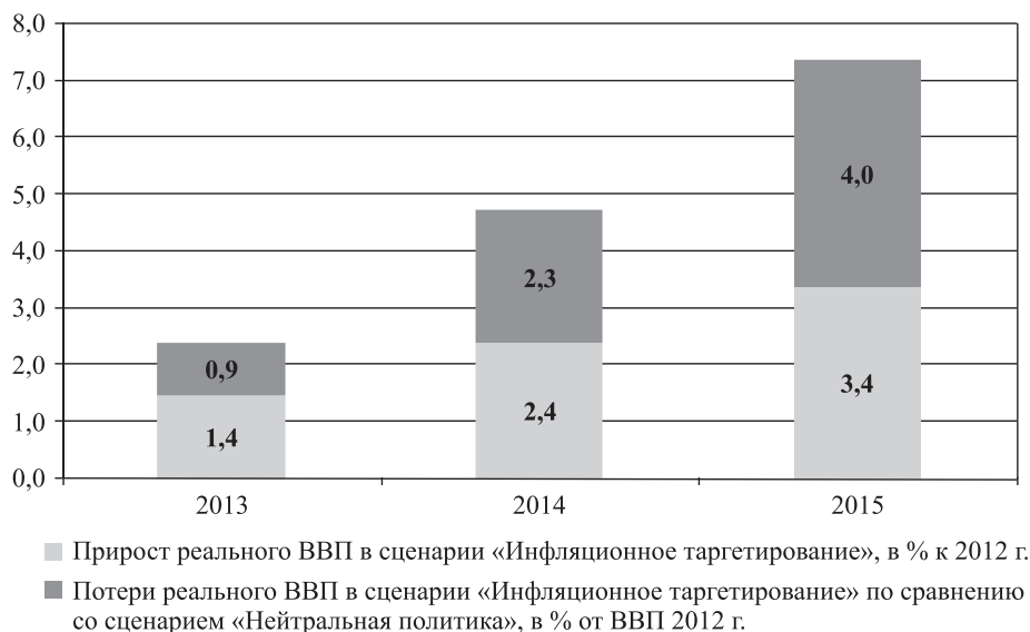
Рис. 2. Оценка потерь ВВП России от следования политике инфляционного таргетирования в 2013–2015 гг. Источник: расчеты по Общеравновесной межотраслевой модели экономики России

ки. Так, к примеру, на рис. 2 приведена оценка потерь ВВП, возникающих в сценарии «Инфляционное таргетирование» по сравнению со сценарием «Нейтральная политика».