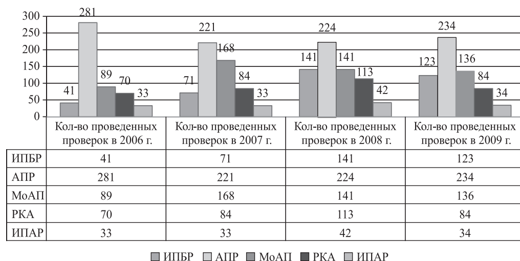
Рис. 1. Количество внешних проверок качества работы аудиторских организаций, проведенных профессиональными объединениями за 2006–2009 гг.

общественно значимых организаций (кредитных и страховых организаций, организаций, ценные бумаги которых допущены к обращению на организованном финансовом рынке, др.). Проверками были охвачены аудиторские организации, расположенные во всех федеральных округах.