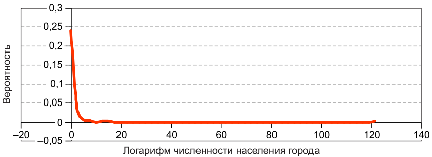
Рис. 1. Распределение городов России по размеру в 2012 г.

асимметрии в распределении, а высокое значение коэффициента вариации свидетельствует о большом разбросе размера городов.