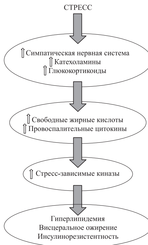
Рис. 2. Общие механизмы развития метаболического дисбаланса при стрессе

линового рецептора-1 и активировать инсулиновый рецептор [105]. В то же время показано, что нейтрализация ФНО- \alpha антителами в крови у генетически предрасположенных к ожирению крыс восстанавливала активацию инсулиновых рецепторов и фосфорилирование тирозиновых остатков в субстрате инсулинового рецептора-1, а также усиливала мембранную проницаемость для глюкозы [106]. ФНО- \alpha наряду с другими провоспалительными факторами является причиной активации JNK/SAPK серин-треониновой киназы, которая выступает как важный медиатор многих физиологических стимулов, начиная от воспаления и кончая стрессом при изменении внешней среды [107]. В литературе представлены экспериментальные доказательства участия JNK киназы в развитии резистентности к инсулину через фосфорилирование серина 307 в субстрате инсулинового рецептора-1 [104], которое индуцируется высококалорийной жировой диетой у дикого генотипа мышей, но не у мышей-нокаутов по JNK киназе [108]. Эти данные позволяют предположить, что дефицит JNK киназы способствует сохранению инсулинового сигнального каскада и выступает как фактор, направленный против развития ожирения, гиперлипидемии и гиперинсулинемии. В отно-