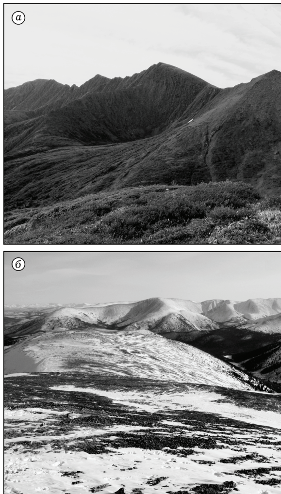
Рис. 2. Основные типы местообитаний лесного северного оленя в центральной части Западного Саяна: а – в летний период, б – зимой

в летний период, когда не только наземные учеты, но и авиаобследования дают низкие показатели численности животных в пределах ООПТ региона.