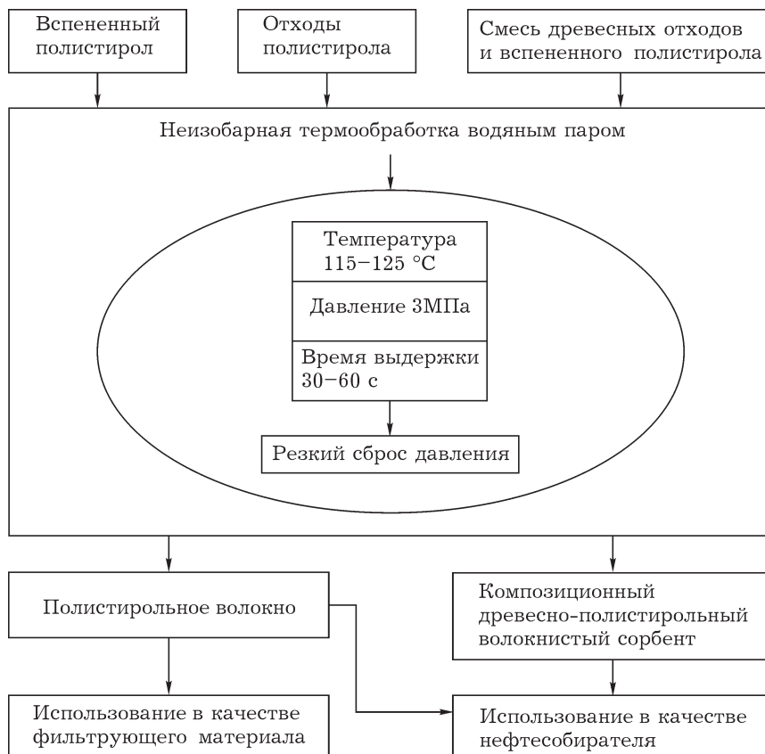
Рис. 1. Схема получения полистирольных волокнистых материалов различного назначения.

Полистирольное волокно получали методом неизобарной термообработки при следующих условиях: температура (115 \pm 5)^\circ\text{C} , давление смеси воздух – пар 3,0 МПа, время обработки 30 с. Древесно-полистирольные волокнистые (ДПВ) сорбенты получали при тем-