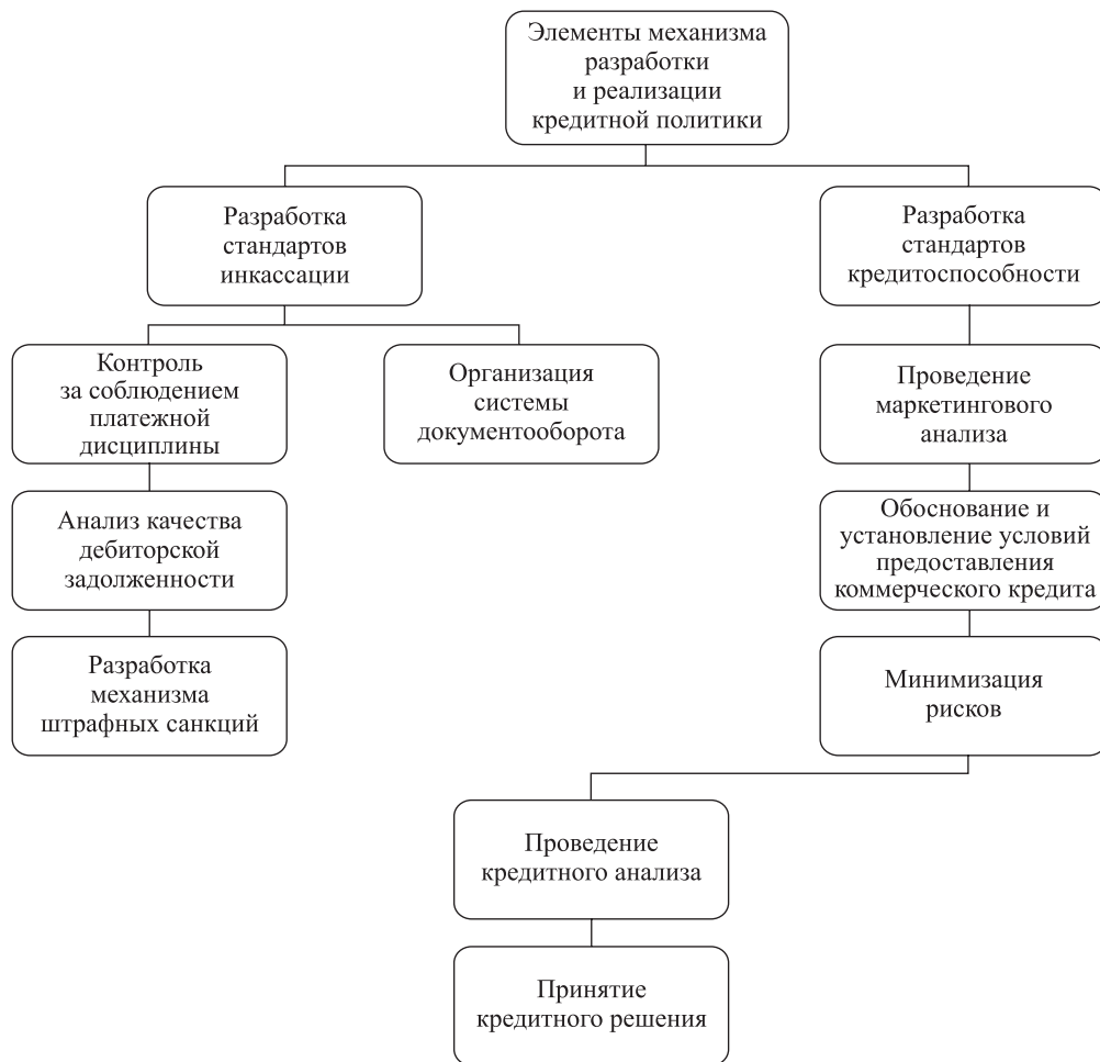
Рис. 4. Элементы механизма кредитной политики организации

кредитной политики необходимо обеспечить плодотворное сотрудничество маркетологов, бухгалтеров, экономистов и финансистов, а кредитную и маркетинговую политику организации следует рассматривать как неотъемлемую часть реализуемой продукции (работ, услуг).