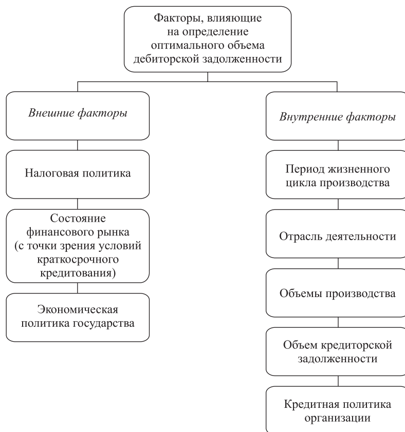
Рис. 2. Факторы, влияющие на оптимальный объем дебиторской задолженности отечественных организаций

стандартный набор процедур для того, чтобы принять решения, какие клиенты должны получить кредит и условия предоставления скидки.