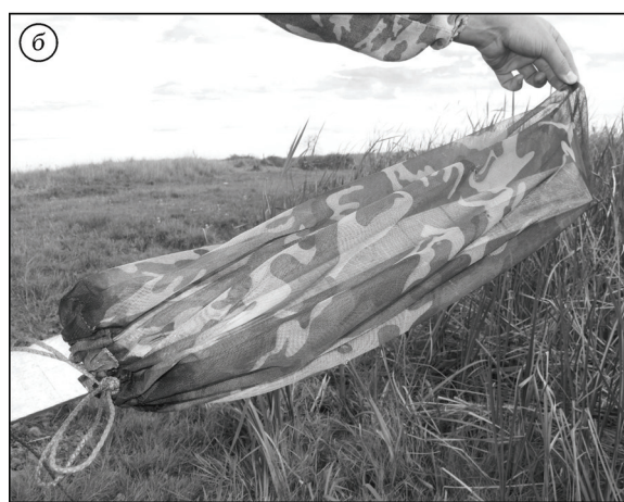
Рис. 2. Конусовидная ловушка: а – с затянутой ловчей частью (сетчатого мешка) у основания опорной рейки; б – при снятии ловчей части с опорной рейки

ные промежутки (2–3 м) по всей прибрежной зоне, заселенной комарами.